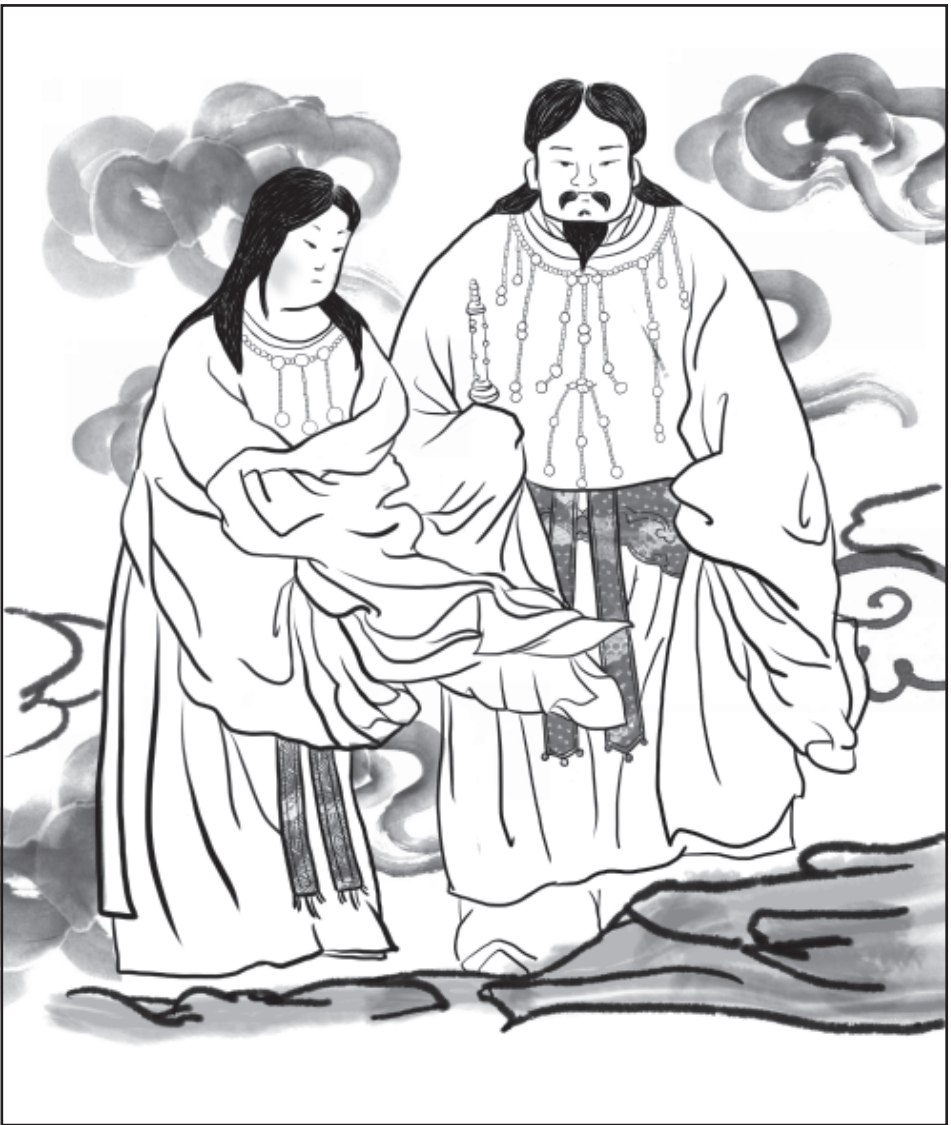
◎ 伊邪那岐命與伊邪那美命