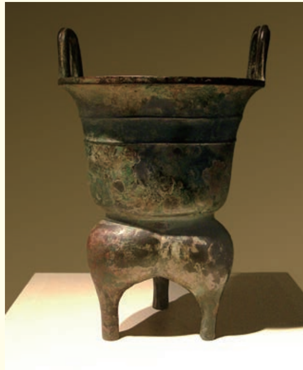
商代的甑鬲（讀贈力）是一種蒸飯用的青銅器，可見當時民眾已用水蒸以煮成熟飯。