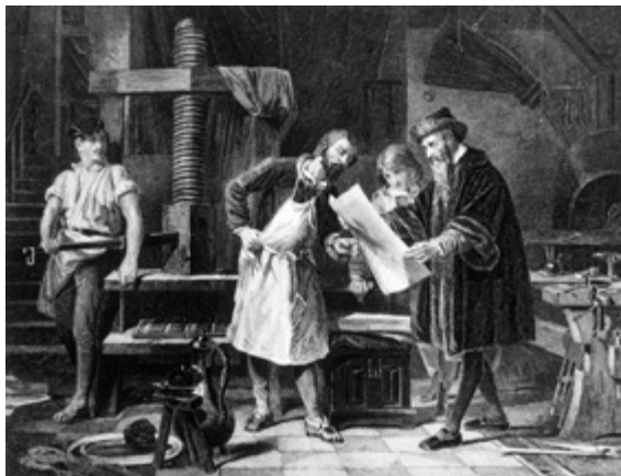
○ 古腾堡发明印刷机