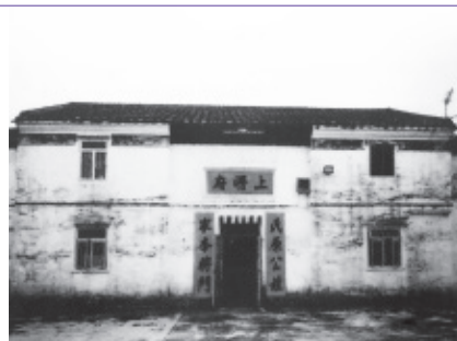
元朗逢吉鄉上將府，由民初軍閥沈鴻英興建，是新界民居的一例。

不同地區由於氣候、地形環境、生活習俗、民族文化傳統、宗教信仰等的不同，在其民居村鎮聚落及住房形式中，皆反映出濃郁的本地鄉土氣息，遊人在欣賞傳統民居