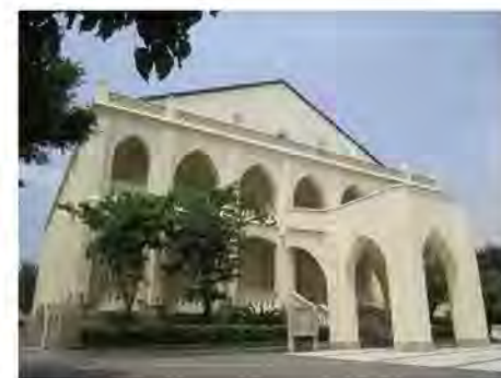
● 伯大尼修院，現為演藝學院古蹟校園。