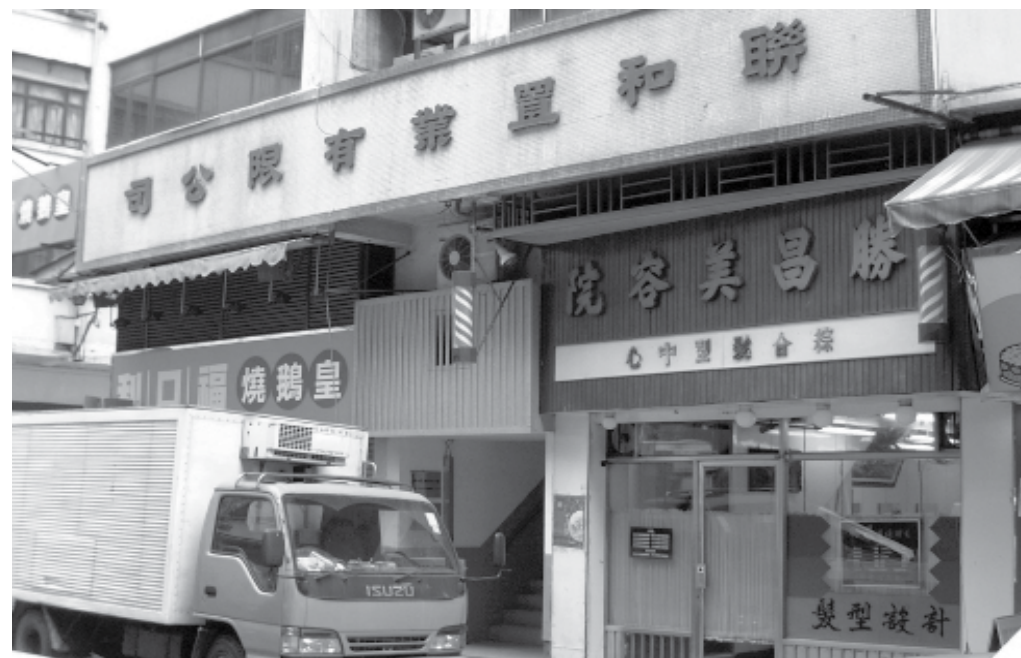
位於和隆街的聯和置業公司辦事處。