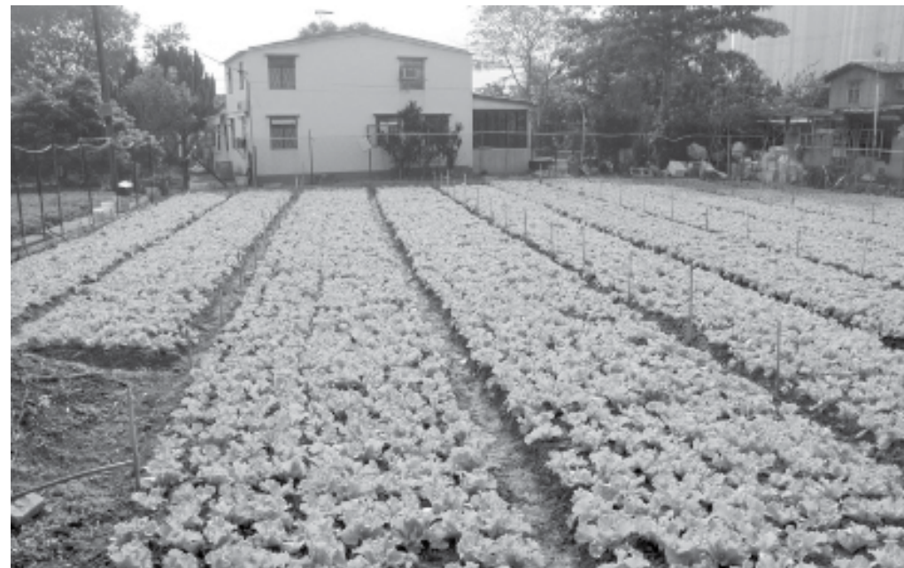
農田種滿了生長快速的唐生菜。該農田亦設置了先進的灑水系統。

另外，當時香港政府有鑒於中國內地政治不穩定，於是積極鼓勵鄉村自發籌建墟市，預防一旦內地停止向外輸出農產品時，香港亦能自給自足。所以，墟市擔當了應付及調節農產品供應的重要組織。除此之外，由於政府指出當時上水石湖墟是新界最不整潔及沒有規劃的墟市 (7) ，故當粉嶺鄉民在當下提出蓋建一個新型、具規劃的墟市時，自