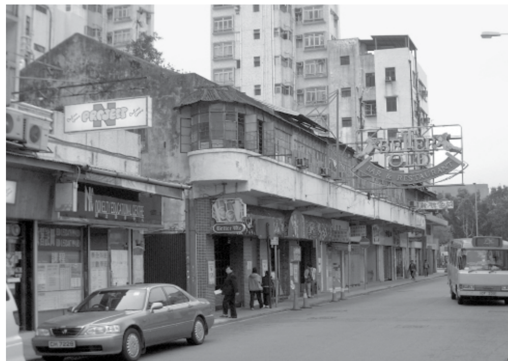
聯和墟最早期的兩層商住樓宇，至今仍保存下來。