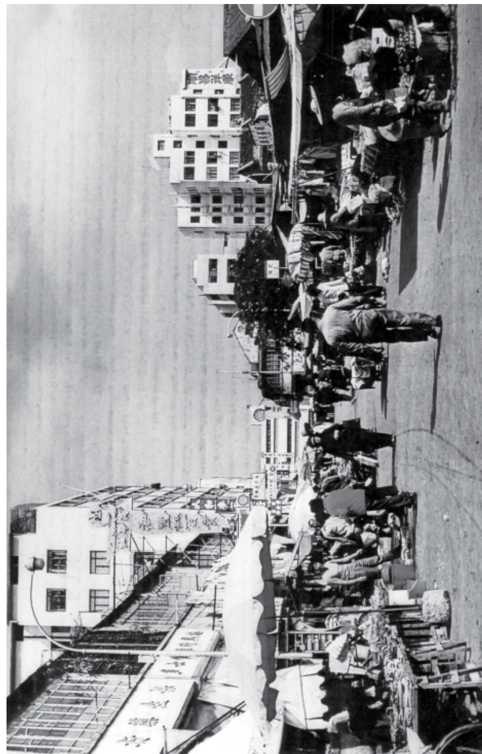
1970年未的聯和墟市場。