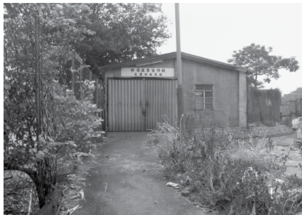
位於安樂村的粉嶺蔬菜合作社，曾用作收集農民運來寄賣的農產品。