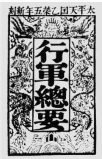
● 太平天國《行軍總要》

石達開雖然身處絕境，但仍然表現出破釜沉舟的英雄氣概。五月十七日，石達開選出精銳千人，分駕船筏，搶渡大渡河。他勉勵將士：「戰必死，降亦必死，均一死也，不如其戰矣！」但在清軍密集槍炮的射擊之下，這支敢死隊全部陣亡。二十一日，他又選出精兵數千人，分乘數十隻船筏強渡大渡河。戰士們用擋牌護身，含刀挺矛，拚命強渡。其餘將士集結南岸吶喊助威，「隔岸呼噪，聲震山谷」。但因水勢兇猛，加之清軍在北岸用大炮轟擊，火力很強，有的船筏被擊